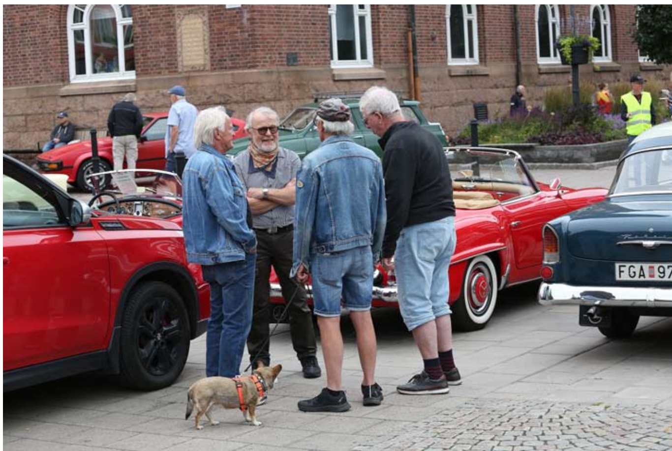
Bilder från en Torgträff 2025