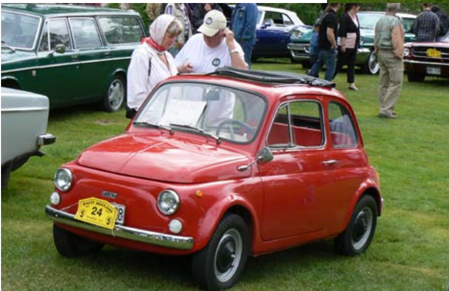
Fiat 500 från 1966

”När jag blir stor vill jag också ha husvagn”