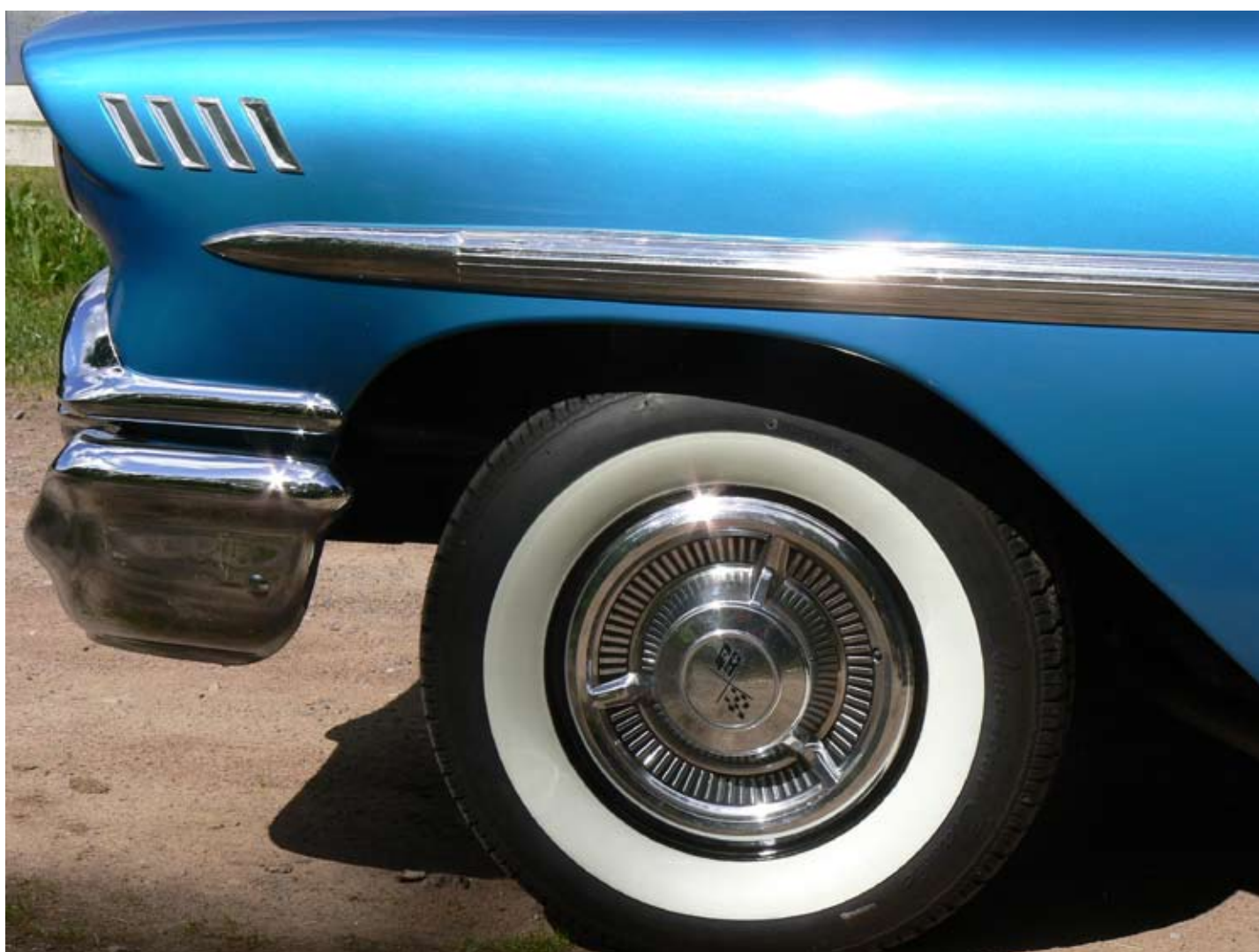
Sylve Jergefelts Chevrolet Impala 58