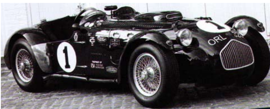
Allard J2X 1952