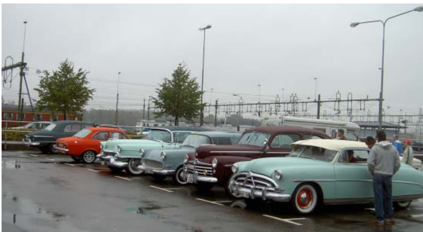
Veteranmarknadens finbilsparkering oktober 2005