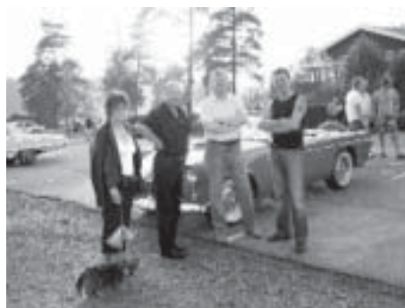
Gruppenfoto på parkeringen...

Under sommaren har klubbträffarna på onsdagskvällar varit förlagda till Sandsjöbaden. Det är ett ställe med camping, restaurang och badplats. Under några somrars tid (vet tyvärr ej hur många) har våra klubbträffar varit förlagda här. En orsak till detta är att det brukar vara så mycket olika fordonsentusiaster som dyker upp kvällstid under sommaren. Alltifrån moppar, mc och diverse bilar och alla med särskilda attribut. Det brukar finnas mycket fint att titta på!