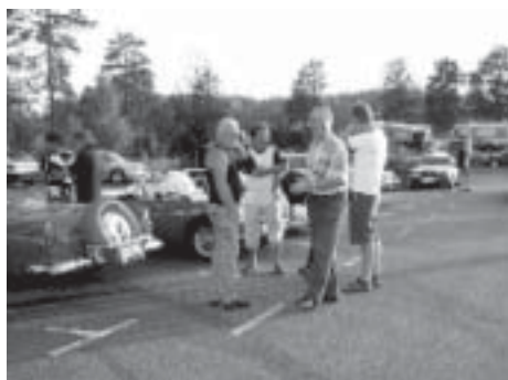
I glada vänners lag i Sandsjöbaden...