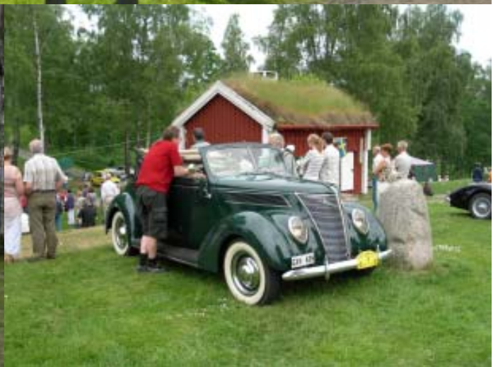
Höglands Rallyt 2006