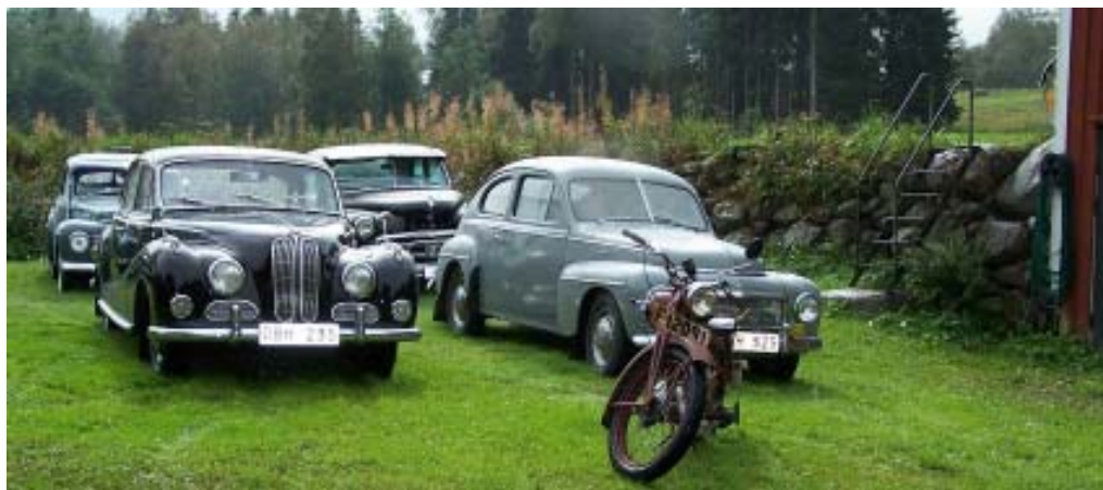
Klubbmästerskap i Möreström