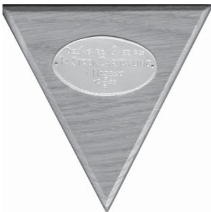
Minnesplakett från Sveriges första Stockcar tävling