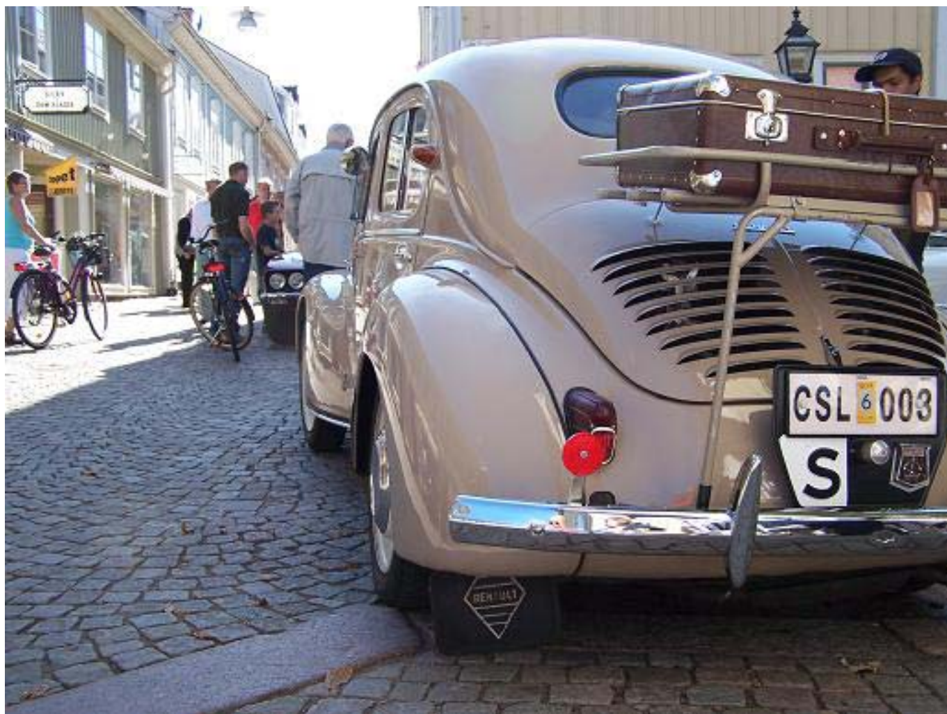
Norra Storgatan, vid Lilla torg, I Eksjö