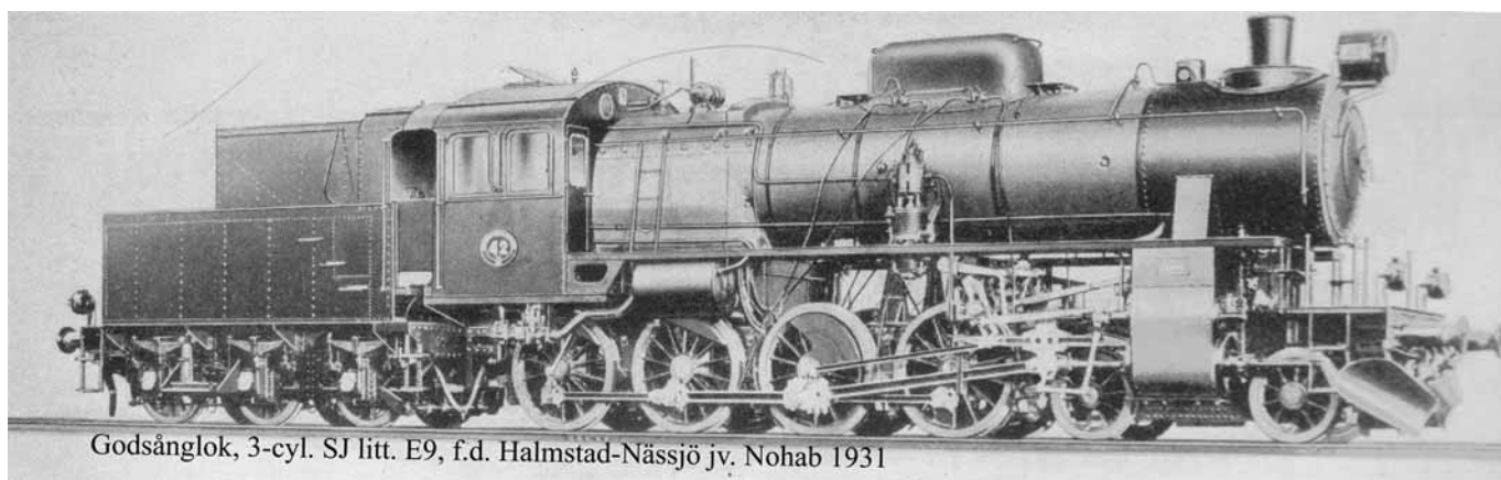
Godsånglok, 3-cyl. SJ litt. E9, f.d. Halmstad-Nässjö jv. Nohab 1931

Det året arbetade jag på SJ det användes en hel del ånglok på den tiden, särskilt vid storhelger sattes extratåg in på de bansträckor som saknade elektrifiering. Då fick dom gamla ångloken användas för att klara passagerartillströmningen. Loken putsades upp och fylldes med vatten och kol. Ångan användes också som värmekälla i personvagnarna via tjocka gummislangar mellan lok och vagnar. Belysning fick man med gaslampor som hängde i taket. Gastuberna var väldigt stora och tunga och var svåra att få på plats under vagnen. En annan sak som man hade besvär med var att byta ljusstrumporna i takbelysningen de var väldigt ömtåliga och skulle knytas fast. Ja jag vill nog helst glömma dessa vinternätter på SJ ofta i tjugogradig kyla. Ett så kallat pålok fick användas när dom långa tunga godstågen skulle upp för backen mot Halmstad, det innebar att ett extra ånglok fick skjuta på vid Åkershällsbacken tills det främre loket orkade dra själv. Påloket återvände sedan till lokstallet igen.