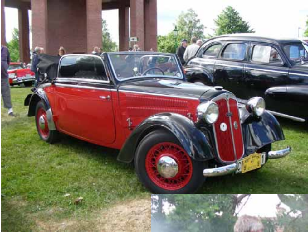
Bilder från Rally Högland 2008