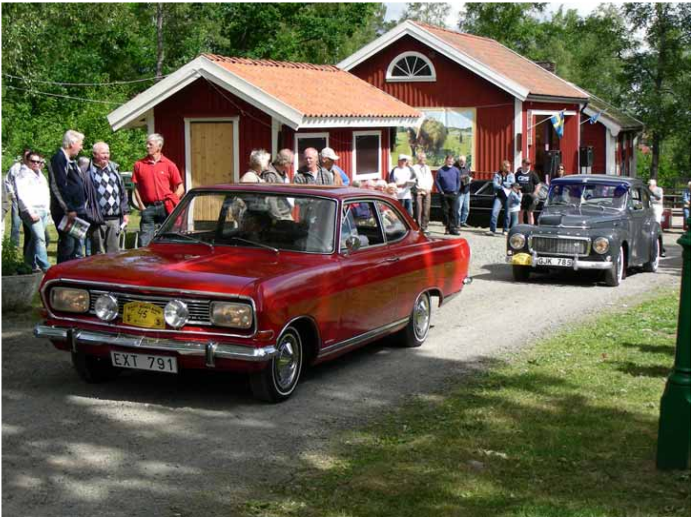
Rally Högland 2008